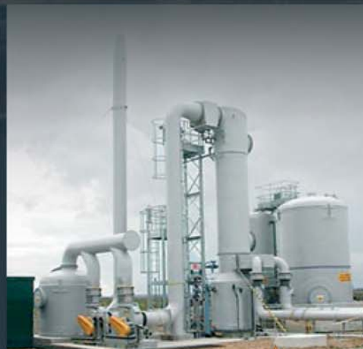
Conception entière du système/de l'installation

Nous serons heureux de vous apporter notre assistance pour discuter d'une application particulière.