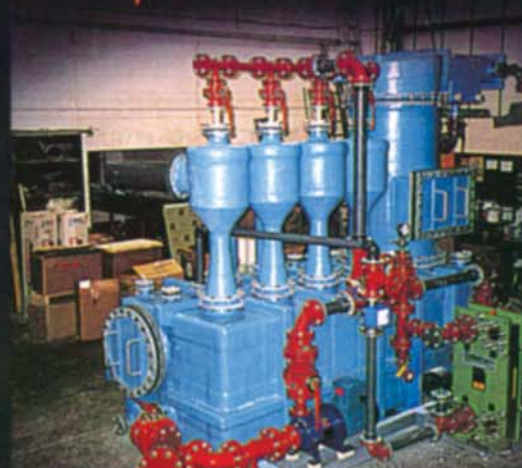
分阶段作业的多功能文氏管与填充塔式净化器，包括去除甲醇和气体