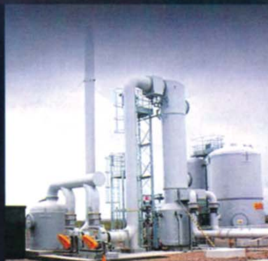
全套系统/设备设计